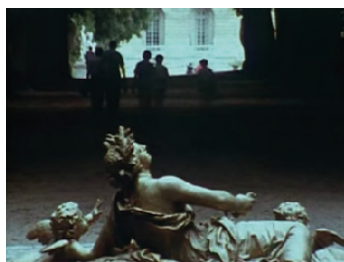
Querelle de jardins ©Raoul Ruiz Francia, 1982