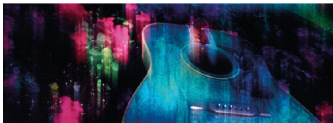
Blue Guitar ©Stephen Broomer EEUU, 2013