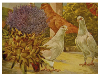
The Ogre's Garden ©Lawrence Jordan Estados Unidos, 2019