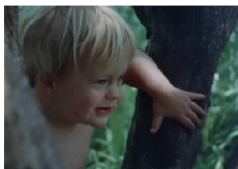
This is it ©James Broughton Estados Unidos, 1971